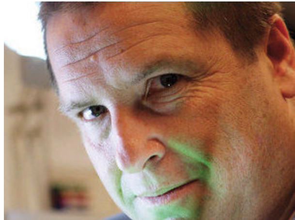
ערן פיין יונתן שאול: צילום

"אני מאמין שתמצא את המוצר שלנו באחד מכל 10 מסכי LCD, באחד מכל 10 מחשבי לפטופ, באחד מכל 10 מקררים ומדפי תצוגה. התאורה המשטחית תהיה שוק שהיקפו מיליארדים, ולדעתי יהיה לנו בו נתח יפה".