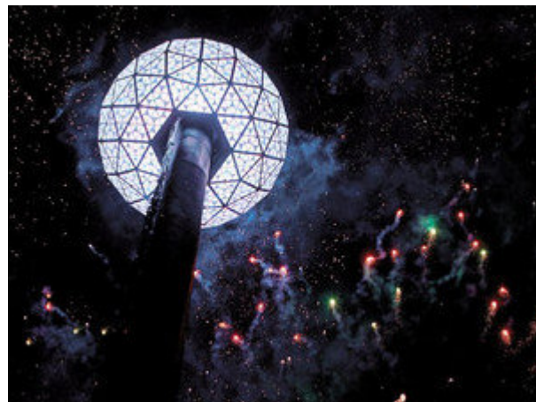
נורות LED בכדור האור המקשט את כיכר טיימס בניו יורק